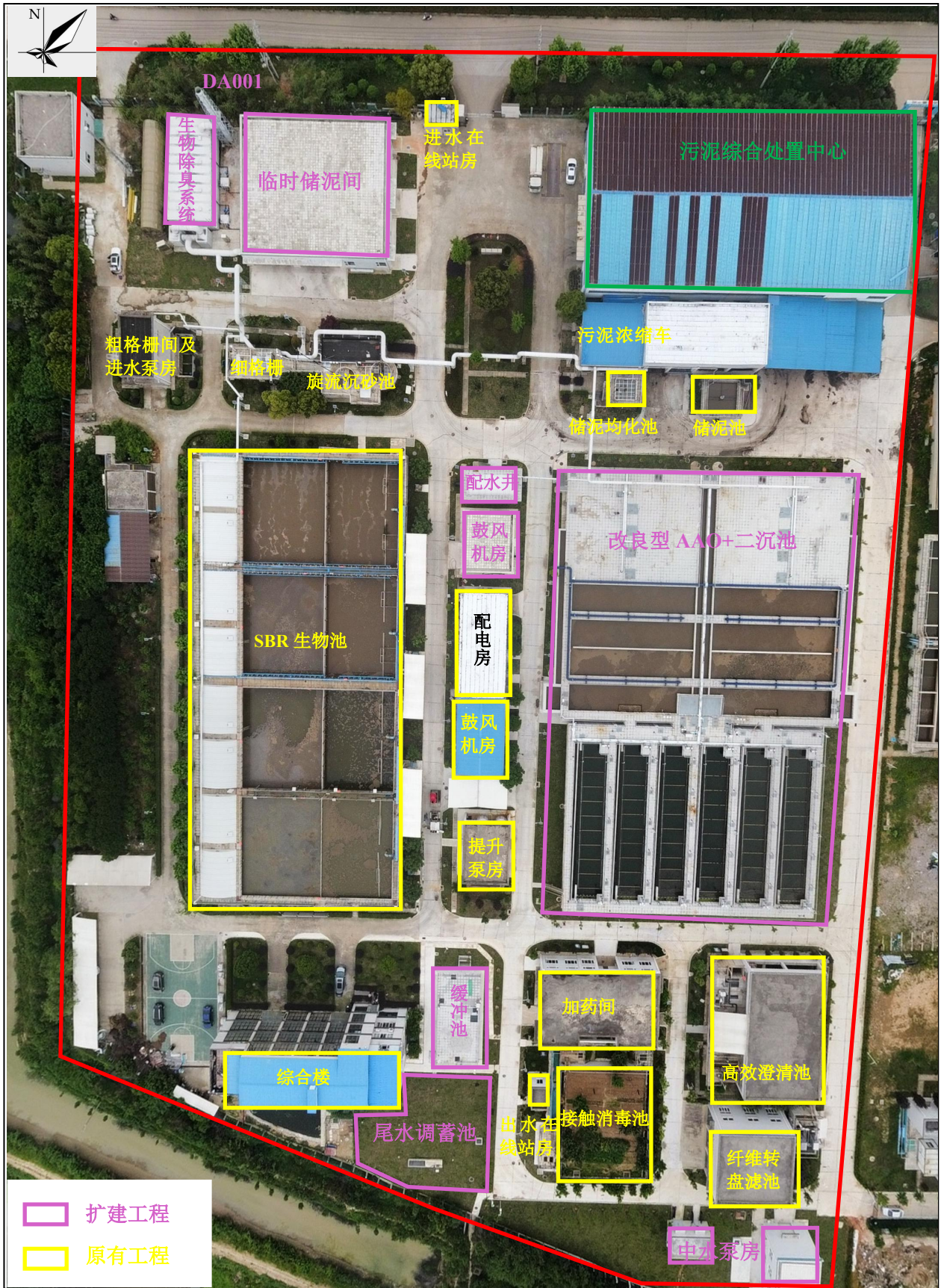
附图 3 项目平面布置图