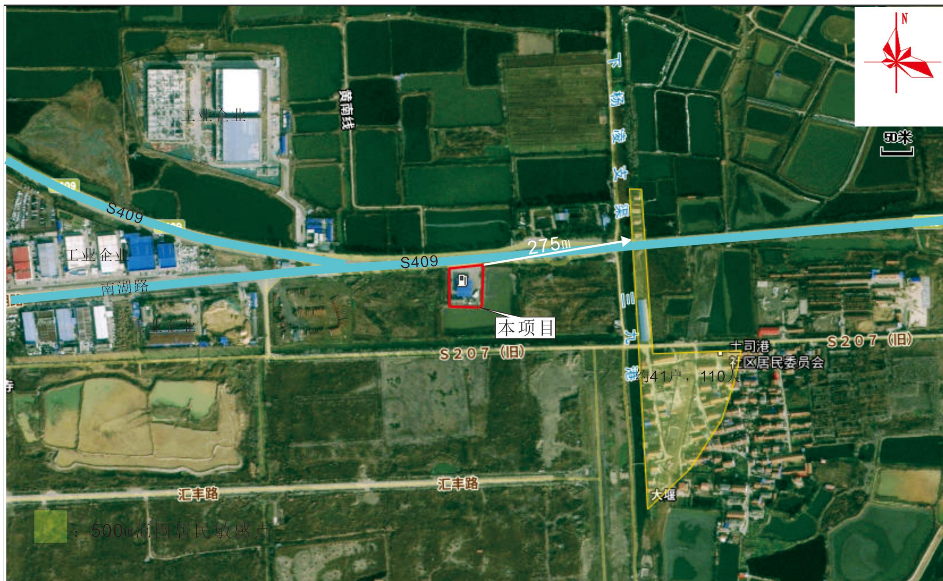
附图2 项目周边关系示意图