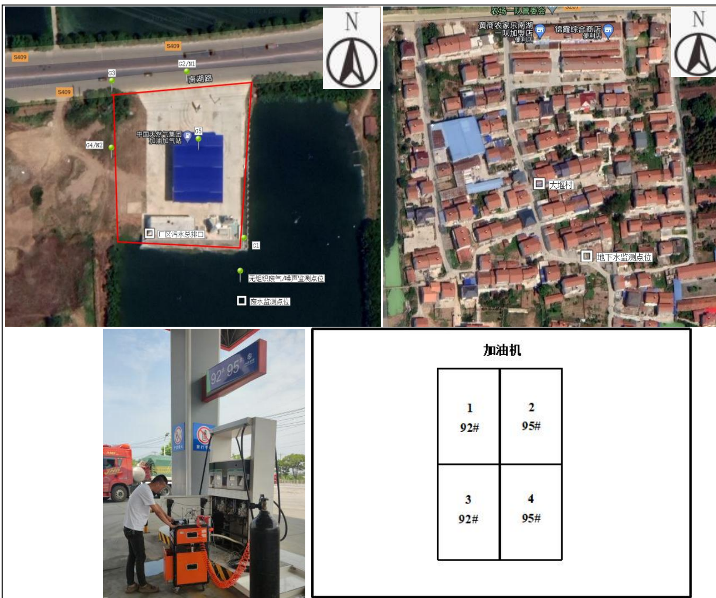
附图4 项目监测点位图